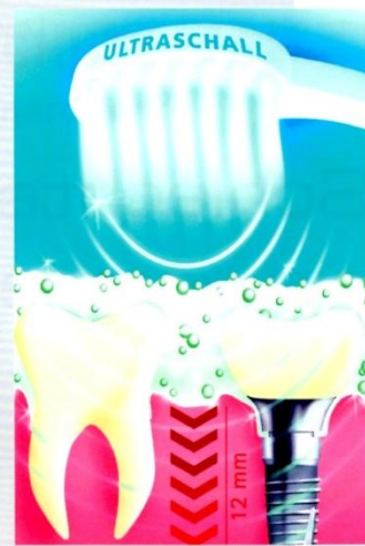
Die Schallwellen der Emmi-dental Professional reinigen bis in eine Tiefe von 12 Millimeter!